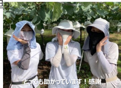
とっても助かっています！感謝