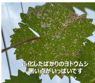
ふ化したばかりのヨトウムシ 黒い点がいっぱいです